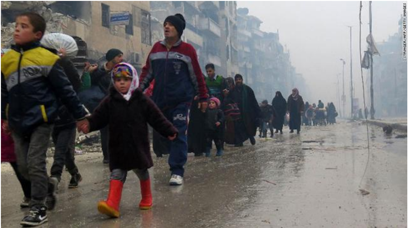
叙利亚灾黎

情报剖析机构Flashpoint Partners表现，“伊斯兰国”对帕尔米拉的攻击凸显出叙利亚战局仍然十分不稳，“这让‘伊斯兰国’武装有时机在胡姆斯省继续挺进，他们已经控制了该帕尔米拉四周几处油气田，可见‘伊斯兰国’武装对能源很是饥渴”。